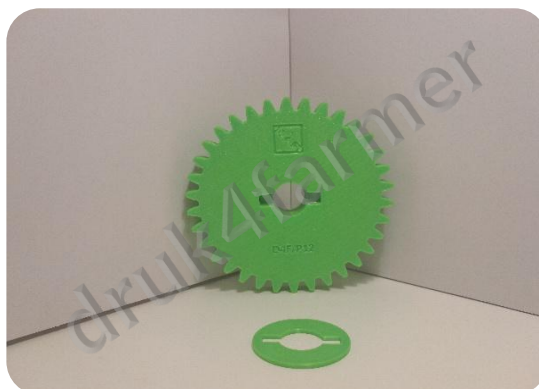
RYSUNEK 2 - WIDOK OD DOŁU