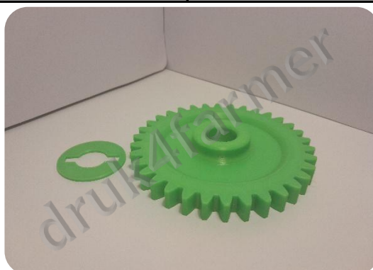
RYSUNEK 1 - WIDOK IZOMETRYCZNY

Podczas wykonywania prac montażowych zaleca się stosowanie rękawic ochronnych oraz okularów ochronnych.