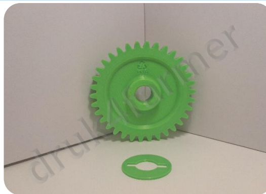
RYSUNEK 5 WIDOK Z PRZODU